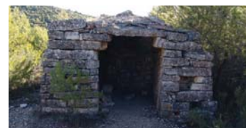
Barraca de Cal Creuetes. Joan Ferran.