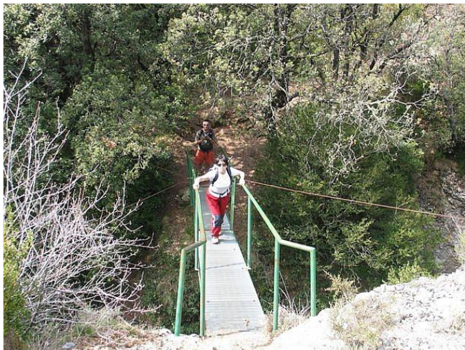
Palanca de Capolatell