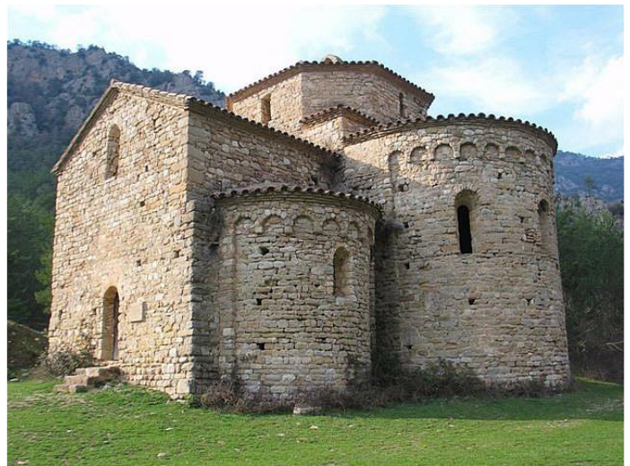
Sant Pere de Graudescales (segle X)