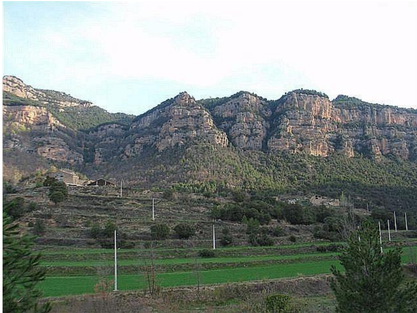
Grau de l’Orriols