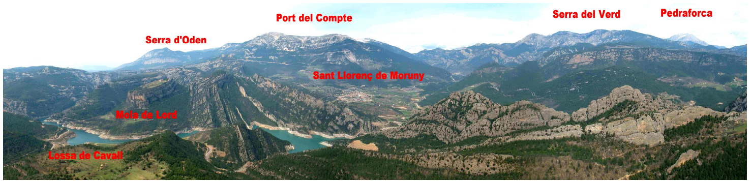
Vista des del Capolatell “presó de Busa”.